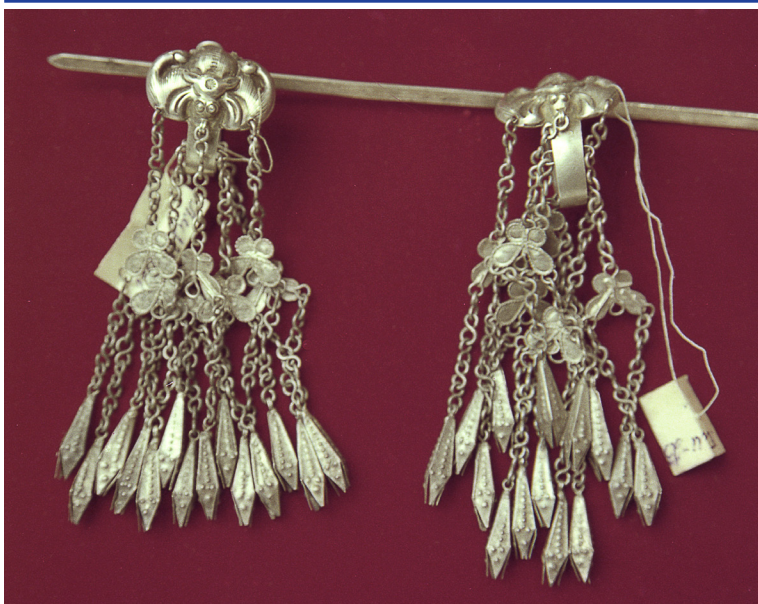
Рис. 4 Подвески. XIX в.

части составляет изображение насекомого с загнутым хоботком. На семи цепочках крепятся плоские украшения в форме крыльев бабочки. К каждой бабочке крепятся еще по две подвески со стилизованными рыбками. Цепочки подвесок прикреплены на разных уровнях.