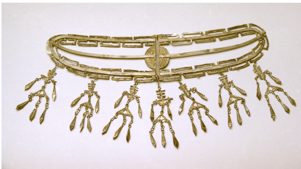
Рис. 3. Налобное украшение в форме диадемы «фэнгуань». XIX в.

10. Налобное украшение в форме диадемы «фэнгуань». XIX в. (Рис. 3) Серебро, чеканка, ковка, пайка. Длина 24 см, вес 50,3 г. Выполнено из листового серебра. В дореволюционной книге поступлений значится как деталь пояса. Состоит из двух частей, скрепленных в центре круглой пластиной. В нижней части на цепочках крепятся семь подвесок. На подвесках имеется символ радости – «си». На каждой подвеске изображено по пять стилизованных рыбок. Четыре подвески отсутствуют.