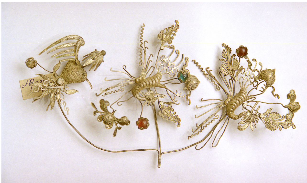
Рис. 1. Навершие шпильки. XIX в.

3. Шпилька . XIX в. Серебро, штамп, чеканка. Длина 24 см, вес 16,3 г. В верхней части навершия имеется иероглиф и украшение в форме черпака (d-1,5 см). На проволоке крепятся украшения: в центре многолепестковый цветок, справа изображение бабочки и насекомого с длинными усами, на конце одного находится маленькая жемчужина; в левой части