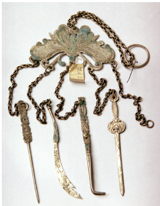
Рис. 6 Туалетный набор, XIX в.

штамп, гравировка, эмаль. Общая длина 38,7 см, вес 58,5 г. Состоит из навершия в форме бабочки и цветка, к которому крепятся пять