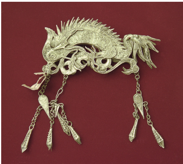
Рис. 2. Заколка-зажим. XIX в.

две стилизованные монеты и четыре гнезда для камней, камни отсутствуют.