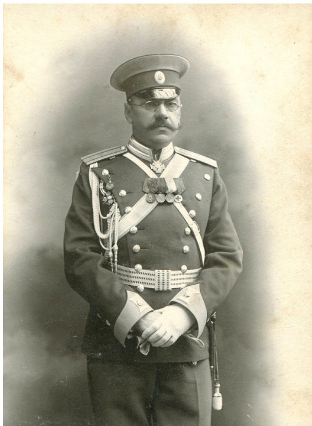
Жандармский полковник, Санкт-Петербург, начало XX в.

ганизации политической полиции на Кубани, руководство Корпуса жандармов уже 12 апреля 1881 г. присвоило ему чин полковника «за отличие по службе» [8, л. 5], в связи с чем ежегодно «получаемое на службе содержание» возросло до 3028 руб. [8, л. 2]. Вместе с тем, «возникшее в последнее время... в районе Кубанской области значительное число дознаний по государственным преступлениям» вызывало серьезную озабоченность начальника КОЖУ, о чем он докладывал в Санкт-Петербург [7, л. 46].