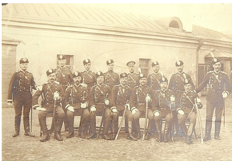
Жандармы. Конец XIX в.

8 февраля 1888 г. Его начальником был назначен подполковник Страхов [26, с. 1–3]. Постепенно шла дальнейшая организация областных жандармских управлений в России: в апреле 1888 г. было образовано Ялтинское, в 1904 г. – Якутское и Кронштадтское, в 1906 г. – Севастопольское [20, с. 110]. В Кавказском крае, в состав которого входила и Кубанская область, политическая полиция к 1905 г. была представлена шестью губернскими (областными) жандармскими управлениями (32 офицера и 139 нижних чинов), двумя крепостными жандармскими командами (2 офицера и 22 нижних чина), Тифлиским охранным отделе-