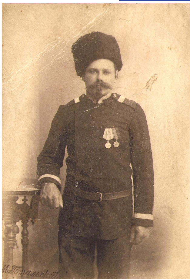
Вахмистр Кубанского областного жандармского управления. Екатеринодар, начало XX в.

нием, Бакинским и Батумским розыскными (охранными) пунктами, Закавказским и Владикавказским жандармскими полицейскими управлениями железных дорог [30, с. 135].