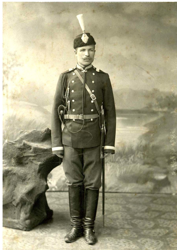
Жандармский унтер-офицер, Санкт-Петербург, начало XX в.

исключительно унтер-офицерами всех родов войск, которые принимались на сверхсрочную службу в Корпус из запаса армии или отставки. О каждом кандидате собирались подробные сведения относительно благонадежности, предыдущем прохождении службы и личных качествах. Зачисление на службу производилось распоряжением начальника жандармского подразделения. В соответствии с § 53 Положения о Корпусе Жандармов от 9 сентября 1867 г., поступивший на службу унтер-офицер обязан был прослужить в жандармерии не менее пяти лет, о чем давал подписку [21]. Приказом № 56 по Военному ведомству от 7 марта 1885 г. унтер-офицерам, увольнявшимся в отставку, назначались пенсии и единовременные пособия с предоставлением «некоторых преимуществ нижним чинам унтер-офицерского звания за сверхсрочную службу» [2, л. 7]. Командир Корпуса генерал-лейтенант П. В. Оржевский в приказе № 25 от 11 марта 1885 г. отмечал: «...этот новый знак Монаршей заботливости, направленный к обеспечению будущности сверхсрочнослужащих жандарм-