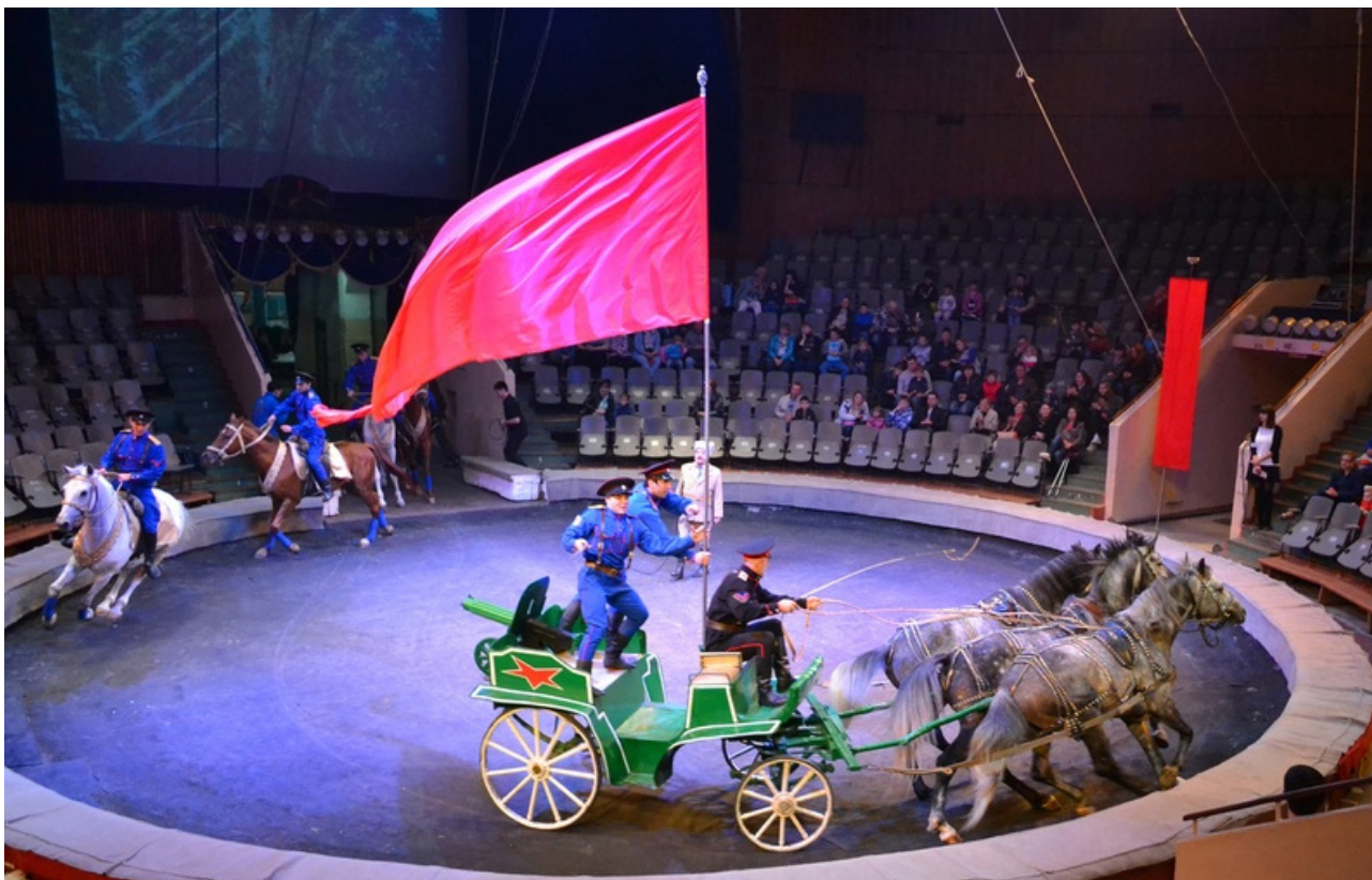
Группа «Кубанские казаки». Афиша выступлений в Италии