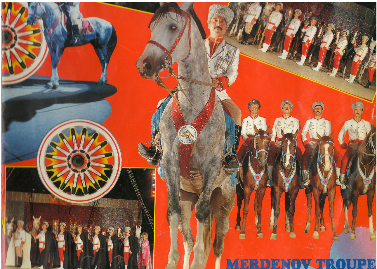
Группа «Кубанские казаки». Афиша выступлений в Италии