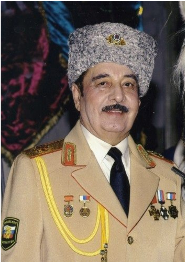
Юрий Петрович Мерденов - артист цирка, наездник-джигит и дрессировщик, педагог. Народный артист РСФСР (1992).

ценности Востока и Запада. Это способствовало формированию здесь исключительно толерантной культурной среды, постоянно подпитывавшейся неизбежными связями азербайджанского народа с другими этносами. Наиболее же тесные социокультурные отношения сложились у Азербайджана с Россией. Их яркое отражение мы находим в живописи и музыке, театре и кино, во многих других видах искусства, и не в последнюю очередь – в цирковом.