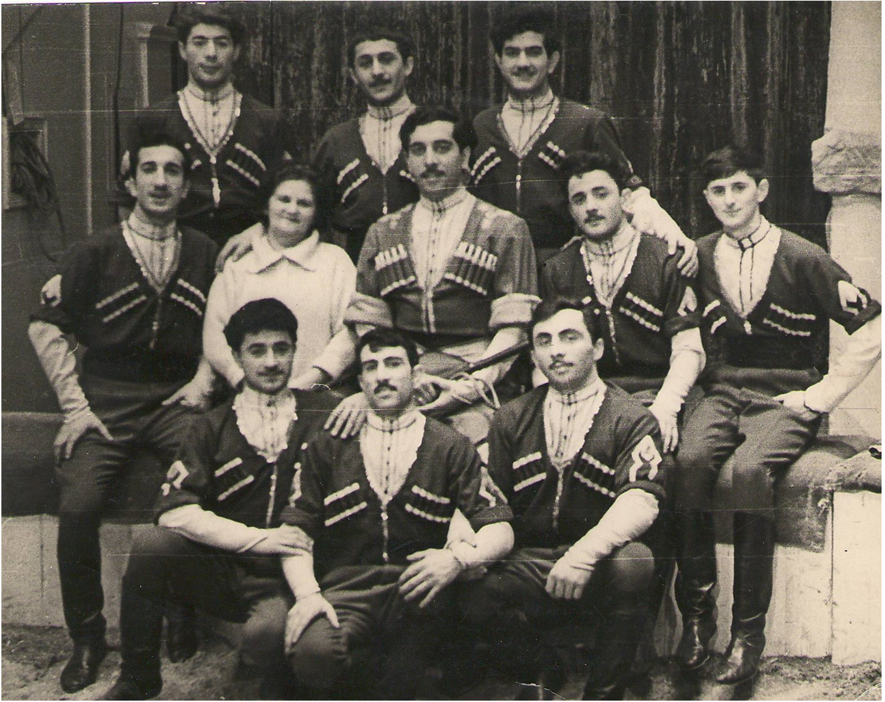
Группа «Джигиты Азербайджана»