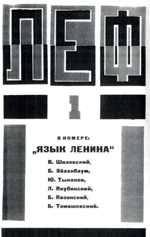
Обложка журнала Левого фронта искусств (ЛЕФ), посвященного В. И. Ленину (№ 1 за 1924 г.)