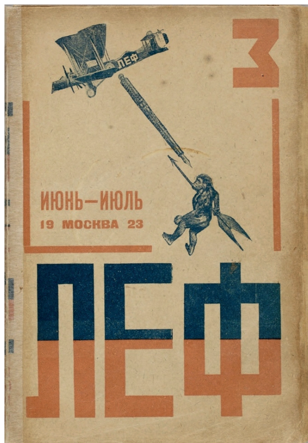
Обложка журнала Левого фронта искусств (ЛЕФ) , в котором был опубликован манифест Дзиги Вертова «Киноки» (№ 3 за 1923 г.)

«Буй» – это стихия, буйство, имеющие еще один подтекст, а именно описание свадебной вакханалии, напоминающей скорее «пир во время чумы». Словарь Владимира Даля указывает, что в Московской и Белгородской губерниях «гонкой на буй» называлось «сходбище девок и парней на простор, откуда они расходятся четами, знакомятся и сватаются» [6, с. 167].