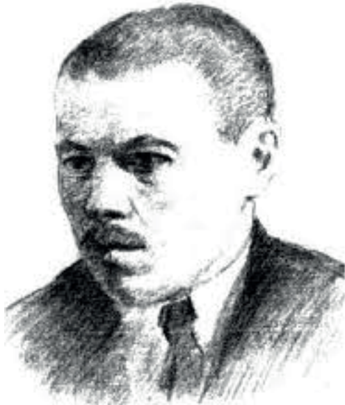
Артем Веселый (Николай Иванович Кочкуров) (1899–1938), русский советский писатель. Рисунок.

То есть для Маяковского Артем Веселый, воспринимавшийся в свое время как писатель, испытавший влияние стилистической манеры Бориса Пильняка и Андрея Белого, оказывается в авангарде современного литературного процесса, наряду с Исааком Бабелем.