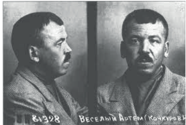
Артем Веселый. Тюремное фото (конец 1937 г.)

Не будем останавливаться на подробностях трагической судьбы Артема Веселого – написано немало монографий, статей, защищены диссертации. Интерес к изучению его творчества то вспыхивал, то затухал. Как отмечает В. Г. Перфильева, «Артем Веселый – сложное художественное явление в контексте развития прозы двадцатых годов. С одной стороны, партийный журналист, с первых дней революции твердо стоящий на большевистских позициях. С другой – художник, наделенный таким масштабом мышления, который позволил ему выйти за пределы узкого-партийного – мышления и рассматривать творчество как процесс интуитивный, стихийный. Артем Веселый обнаружил такое увлечение стихийностью, что вызывал нарекания со стороны критиков, недоумевающих по поводу интересов в литературе этого «бродячего» писателя» [9].