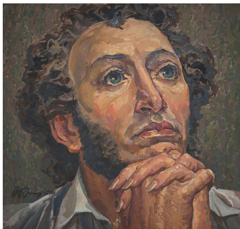
Рис. 4. Баркин В. Ф. Солнце русской поэзии. (2000). Холст, масло. 40 см x 40 см.