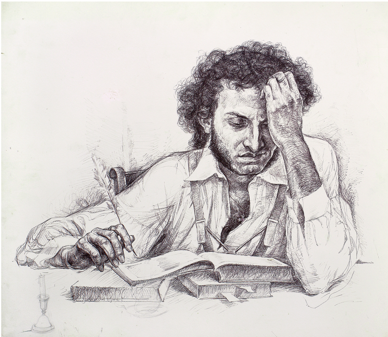
Рис. 2. Баркин В. Ф. Поэт. (2000). Бумага, шариковая ручка. 65 см x 75 см. Fig. 2. Vitaly Barkin. Poet (2000). Paper, ballpoint pen. 65 cm x 75 cm.

никакого намека на статуарный портрет: Пушкин одет в кипенно-белую рубашку с расстегнутым воротом (атрибут байронизма), взгляд направлен на лежащую перед ним стопку книг с закладками. Гусиное перо в правой руке; левая – подперла в раздумье голову. Тонкие длинные пальцы полны энергии, глаза опущены, они видят то, что претворится в звучный стих, через мгновение послушно ляжет на бумагу. Образ А. С. Пушкина прост, убедителен, человечен, жив и лиричен (Рис. 2).