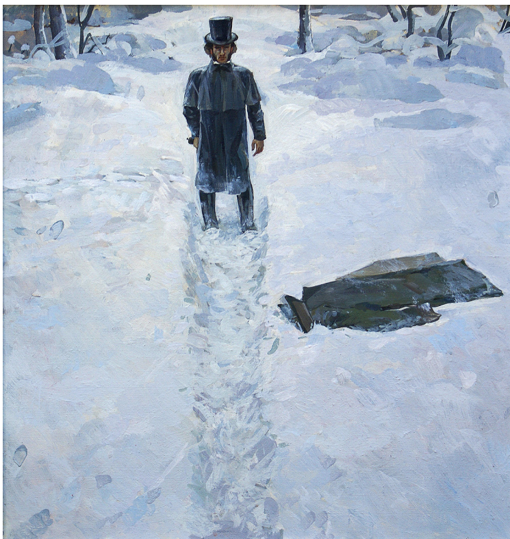
Рис. 5. Баркин В. Ф. Дуэль. (1999). Холст, масло. 51 см x 48 см.