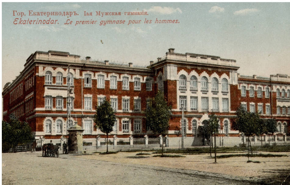
Рис. 3. Здание Екатеринодарской 1-й мужской гимназии. После 1905 г.