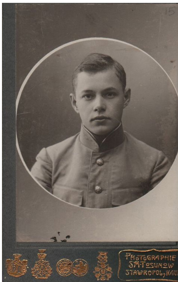
Рис. 5. Николай Богданов-Катков. 1911 г.