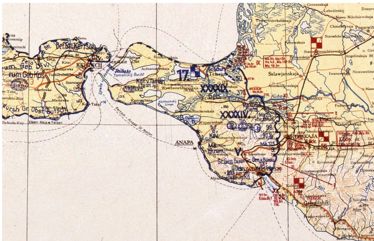
Рис. 2. Положение войск 17-й армии к концу августа 1943 г. Фрагмент немецкой карты Fig. 2. Position of the troops of the 17th Army by the end of August 1943. Fragment of a German map

ной армии и около 30% ВВС Черноморского флота, причем преобладала штурмовая и ночная бомбардировочная авиация. Недостаток полноценных бомбардировщиков ограничивал ударные возможности и дальность действия советской авиации.