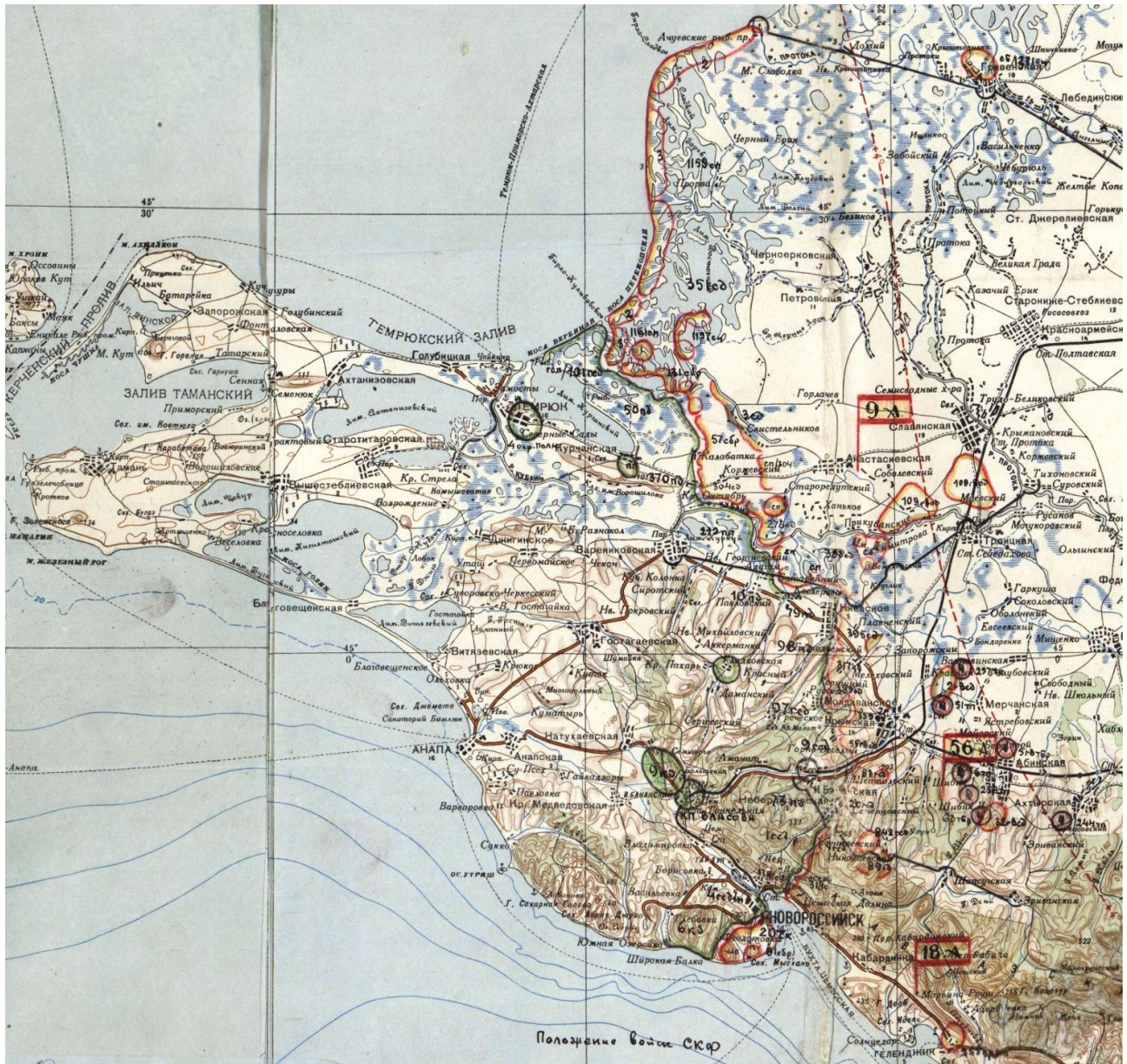
Рис. 1. Положение войск Северо-Кавказского фронта к концу августа 1943 г. Фрагмент советской карты Fig. 1. Position of the troops of the North Caucasus Front by the end of August 1943. Fragment of a Soviet map

вых резервов так же находилась в ее полосе. Такое положение сложилось со времени попыток прорвать центральный участок немецкой обороны в мае — июне 1943 г., но совершенно не соответствовало замыслу нанести первый удар с юга войсками 18-й армии.