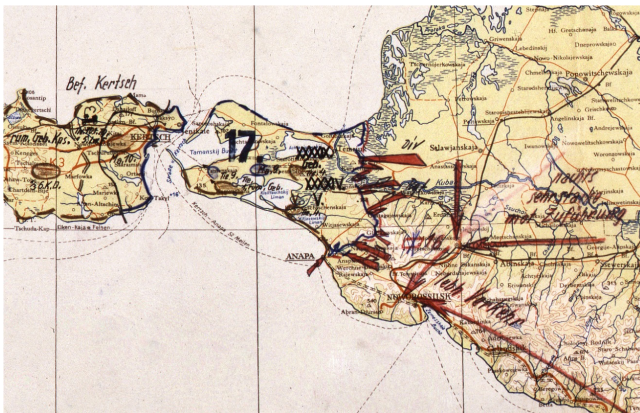
Рис. 4. Положение войск 17-й армии на 22 сентября 1943 г. Фрагмент немецкой карты Fig. 4. Position of the 17th Army troops on September 22, 1943. Fragment of a German map

В этой же директиве были отданы распоряжения о подготовке морских десантов в районе Голубицкой и Благовещенской, на северном и южном флангах обороны противника. Их целью стали пути отступления немцев