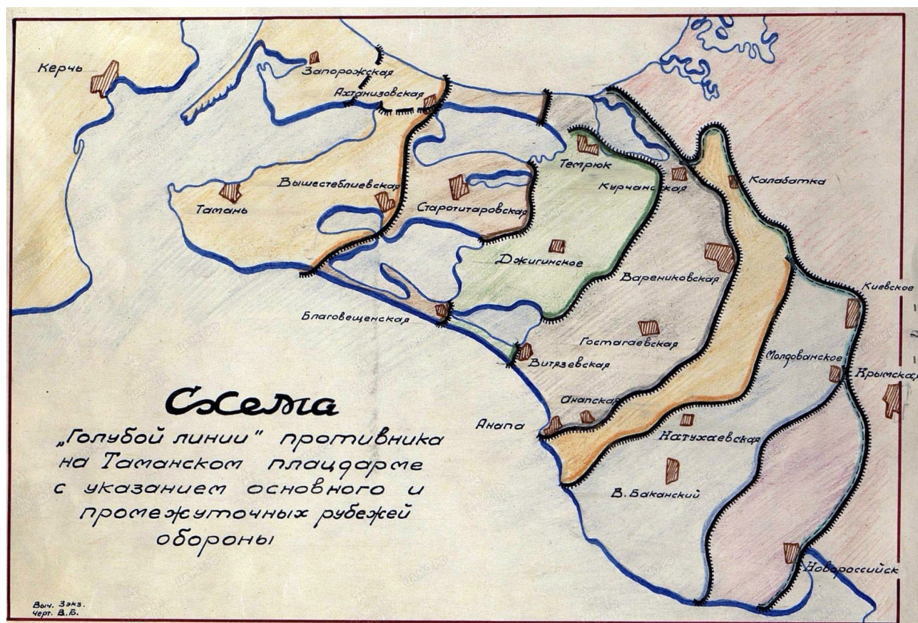
Рис. 3. Основной и промежуточные рубежи «Голубой линии». Советская схема Fig. 3. The main and intermediate lines of the "Blue Line". A Soviet scheme

шей, однако это в избытке компенсировалось водными преградами. Наиболее укрепленным являлся центральный отрезок «Голубой линии», протяженностью более 30 км. Несколько слабее оборудован южный фланг немецкой обороны, но он проходил через городскую черту Новороссийска и горно-лесную местность, что само по себе затрудняло его прорыв [1, с. 117].