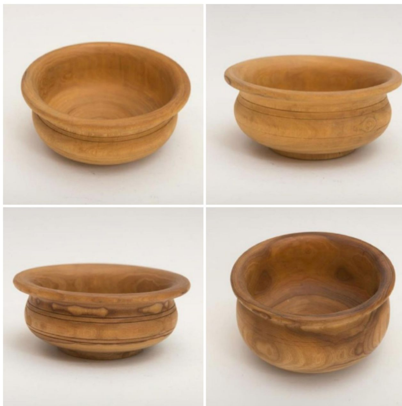
Рис. 1. В. У. Куберлинов. Набор чаш (1990). Дерево, резьба. Государственный музейно-выставочный центр «РОСИЗО».

Возвращаясь к обзору артефактов, следует обратить внимание на калмыцкую коллекцию Российского этнографического музея и особо отметить «Ведерко-Домбо» (начало XX в.) (РЭМ 8761–14982), форма которого отражает традиционный конусовидный силуэт калмыцкой посуды. Подобные сосуды изготавливали из скрепленных пластин красного дерева, дуба или ореха, плотно обтягивали четырьмя или пятью обручами из стали, меди, реже из серебра. Металлические обручи, стягивающие деревянный корпус на разной высоте сосуда, становятся главным акцентным элементом декора. В этом же музее на выставке «Народы великой степи: буряты, калмыки» в 2022–2023 гг. экспонировался калмыцкий