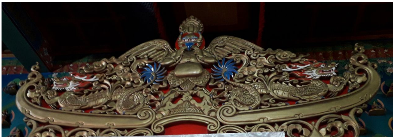
Рис. 13 (а). В. Б. Манджиев. Фрагмент Главного ритуального трона в храме Сякюсн-сюмэ (1989). Дерево, резьба, роспись. Буддийский храм «Сякюсн-сюмэ», г. Элиста.