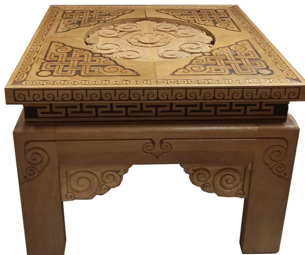
Рис. 6 (b). И. Е. Наранов. Столик из набора мебели «Ханский» (2020). Дерево. Национальный музей Республики Калмыкия имени Н. Н. Пальмова.