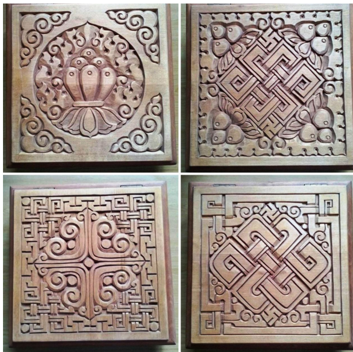
Рис. 8. И. Е. Наранов. Крышки шкатулок (2020). Дерево. Частная коллекция.

Вопрос происхождения способа орнаментальной насечки металлом по дереву как метода декора у калмыков изучен мало, относится к сфере этнокультурных