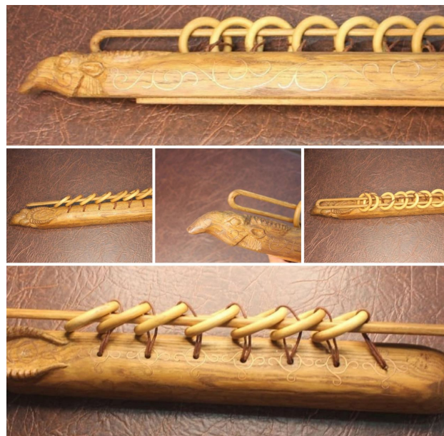
Рис. 10. Л. В. Буджиков. Калмыцкая народная игра-головоломка «Нярн шинже» (2019). Дерево, металл, инкрустация. Частная коллекция.

Выставочный экземпляр «Нярн шинже» стал прототипом массового образца этой