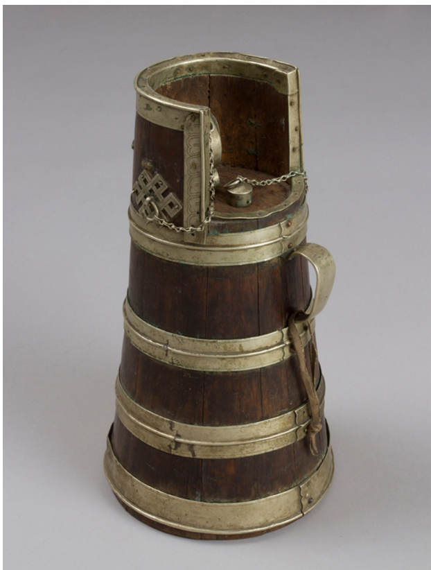
Рис. 2. Сосуд для чая. Калмыки (начало XX века). Дерево, металл. Российский этнографический музей.