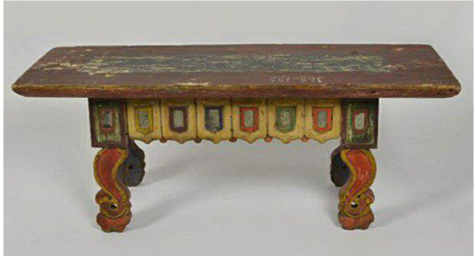
Рис. 5. Столик. Калмыки (конец XIX – начало XX в.). Дерево, стекло зеркальное, краска. Российский этнографический музей.

та подстолья отсылает к силуэту ритуальных тканевых лент-штан-дартов, различных по цвету фигурных флажков, традиционно используемых в интерьере буддийского храма и расположенных рядом с изображениями божеств. Сохранившийся яркий образец калмыцкой мебели демонстрирует народное представление о палитре цветов, используемых при декорировании деревянных вещей в юрте кочевника (Рис. 5).