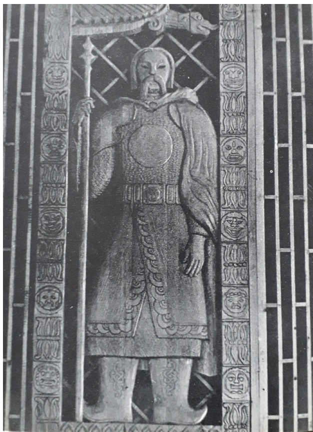
Рис. 11 (б). В. С. Васькин. Фрагмент оформления книжного магазина «Теегин герл» в г. Элиста (1969). Дерево, резьба. Нынешнее местонахождение неизвестно.

Fig. 11(a). Vladimir Vaskin. Fragment of the design of the Teegin Girl bookstore, Elista (1969). Wood, carving. Current location unknown.