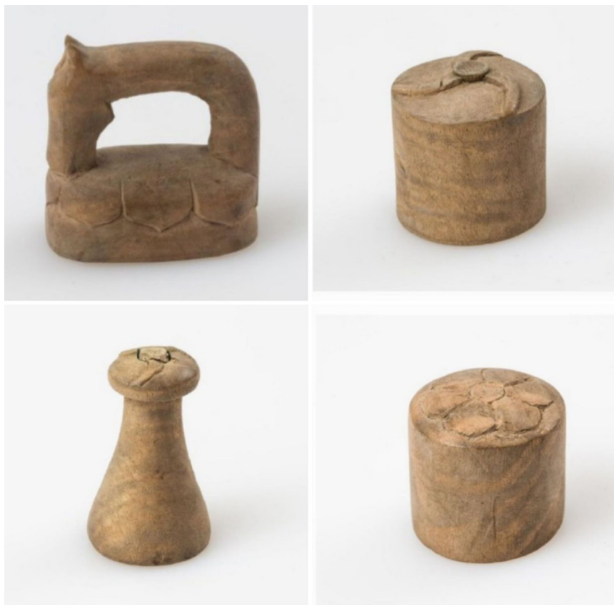
Рис. 4. Фигуры шахматные - шатыр. Калмыкия (конец XIX века). Дерево, резьба. Российский этнографический музей.