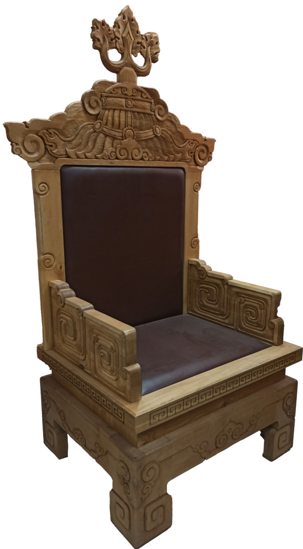
Рис. 6 (а). И. Е. Наранов. Кресло из набора мебели «Ханский» (2020). Дерево, экокожа. Национальный музей Республики Калмыкия имени Н. Н. Пальмова.