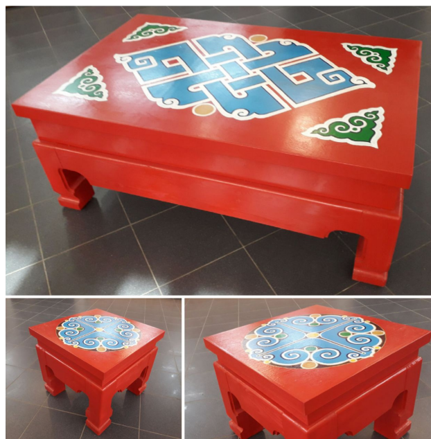
Рис. 7. И. Е. Наранов. Мебельный гарнитур «Калмыцкий» (2021). Дерево, роспись. Частная коллекция.

онный метод вырезания деревянного рельефа при помощи стамесок [3] (Рис. 8). В декорировании массовых образцов подобных шкатулок автор применяет современные технологии лазерной гравировки дерева и фанеры, что способствует художественному разнообразию утилитарных вещей, делает их доступными в качестве сувенира, выполненного в этническом стиле.