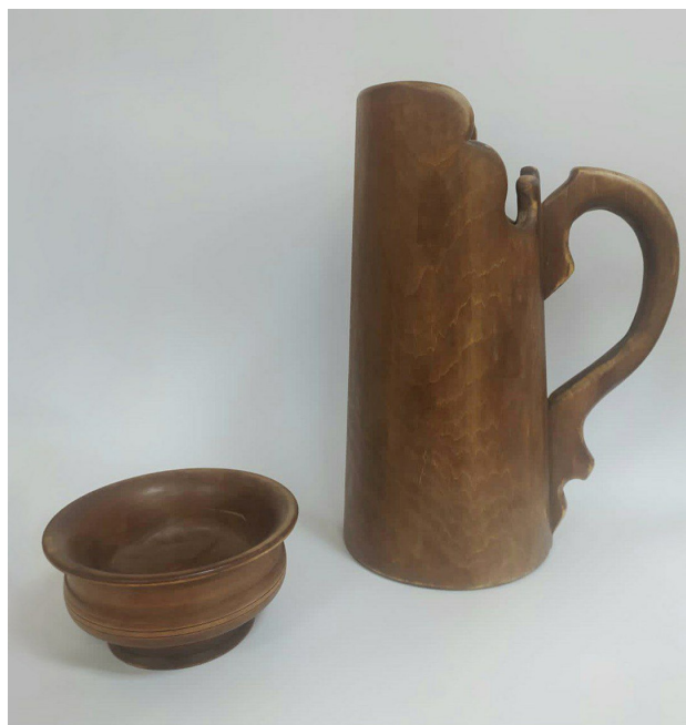
Рис. 3. Г. Н. Ушанова. Кумысный набор (1982). Дерево. Национальный музей Республики Калмыкия им. Н.Н. Пальмова.

Особо привлекает оригинальной аскетичной стилизацией изящная головка фигуры шахматного коня, чья функция и название в калмыцких шахматах такие же, как и в общепринятой версии данной игры. В декоре основания этой шахматной фигуры легким, едва заметным рельефом плосковыемчатой резьбы выявлены силуэты лепестков лотоса,