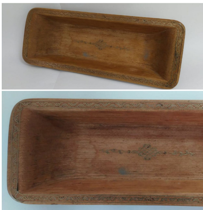
Рис. 9. Г. С. Васькин. Тевш. Блюдо (1982). Дерево, металл, инкрустация. Национальный музей Республики Калмыкия имени Н. Н. Пальмова.