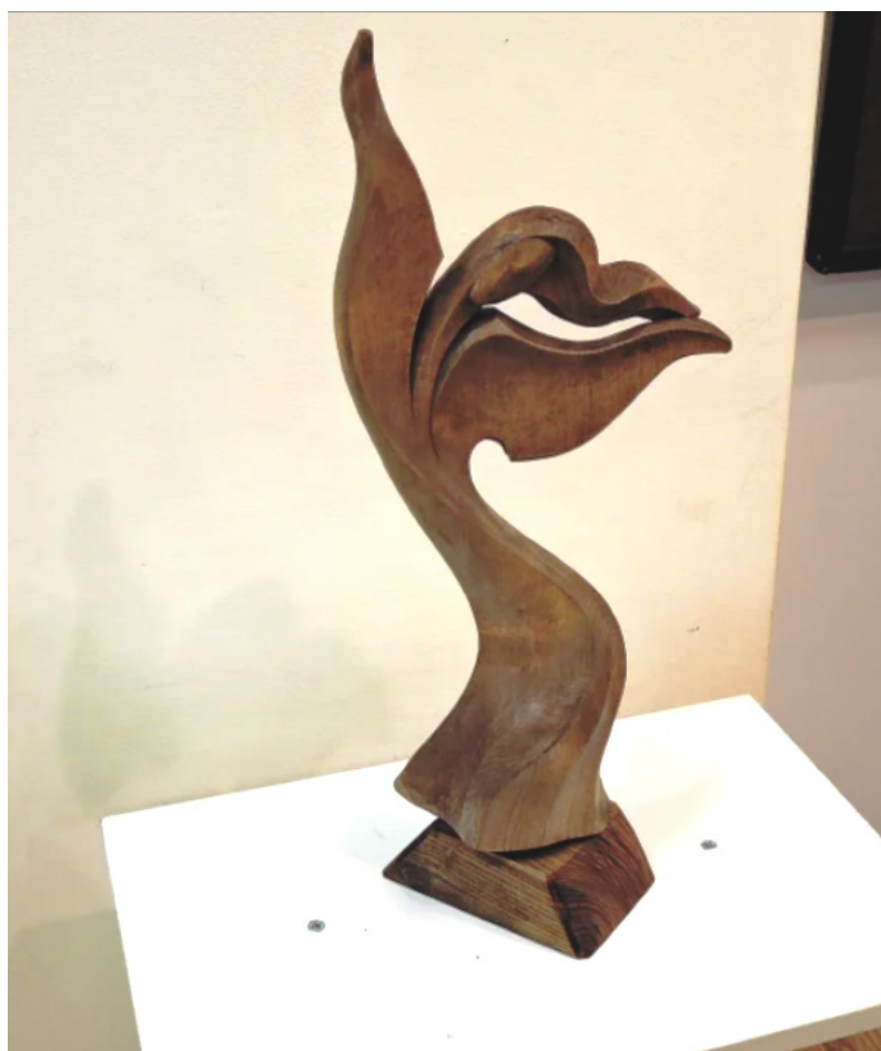
Рис.12. В. У. Куберлинов. «Танец» (2000). Дерево. Собственность автора.

Композиция трона восходит к структуре торана , элементами которой являются своео-