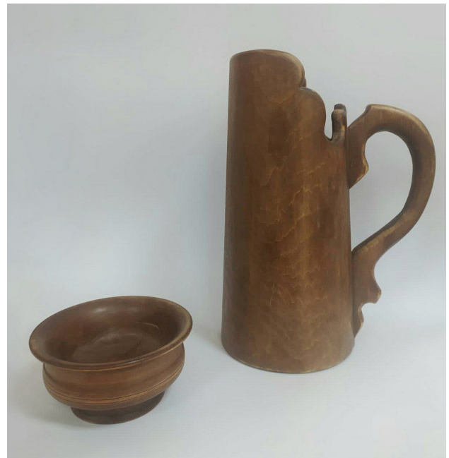
Рис. 3. Г. Н. Ушанова. Кумысный набор (1982). Дерево. Национальный музей Республики Калмыкия им. Н.Н. Пальмова.

Особо привлекает оригинальной аскетичной стилизацией изящная головка фигуры шахматного коня, чья функция и название в калмыцких шахматах такие же, как и в общепринятой версии данной игры. В декоре основания этой шахматной фигуры легким, едва заметным рельефом плосковыемчатой резьбы выявлены силуэты лепестков лотоса,