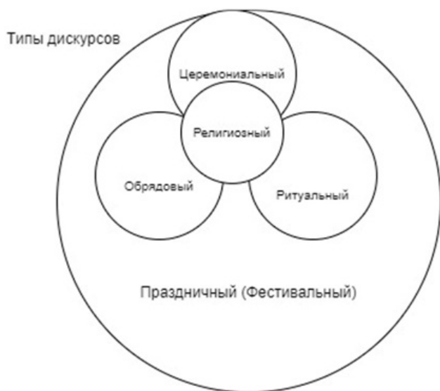
Рис. 2. Типы дискурсов, связанные с концептом «праздник»