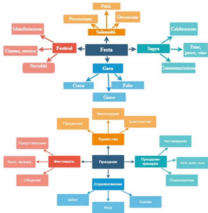
Рис. 1. Семантическое поле концепта Festa (праздник), итальянский и русский языки