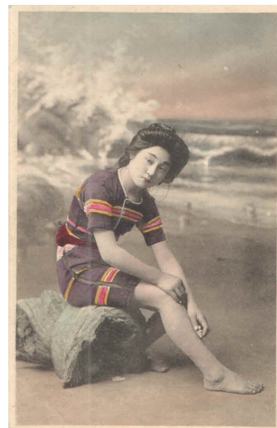
Рис. 8. Открытка «Японка». Япония, начало XX в. Из фондов КГИАМЗ имени Е.Д. Фелицына (КМ 7511/2315) Fig. 8. Postcard "A Japanese". Japan, early 20th century. From the funds of the Felytsin Krasnodar Museum (КМ 7511/2315)

Благодаря тому, что одни и те же места сфотографированы в разный период, можно увидеть, как менялась местность. Например, несколько открыток разных лет изображают пляж Пески, Малую бухту в Анапе.