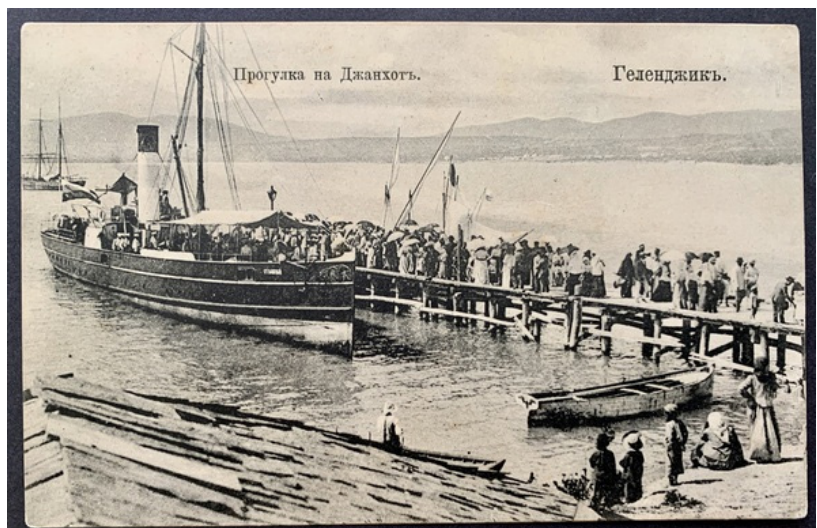
Рис. 5. Открытка «Геленджикъ. Прогулка на Джанхотъ». Россия, между 1904 и 1909 гг. Из фондов КГИАМЗ им. Е. Д. Фелицына (КМ 8365/12612)