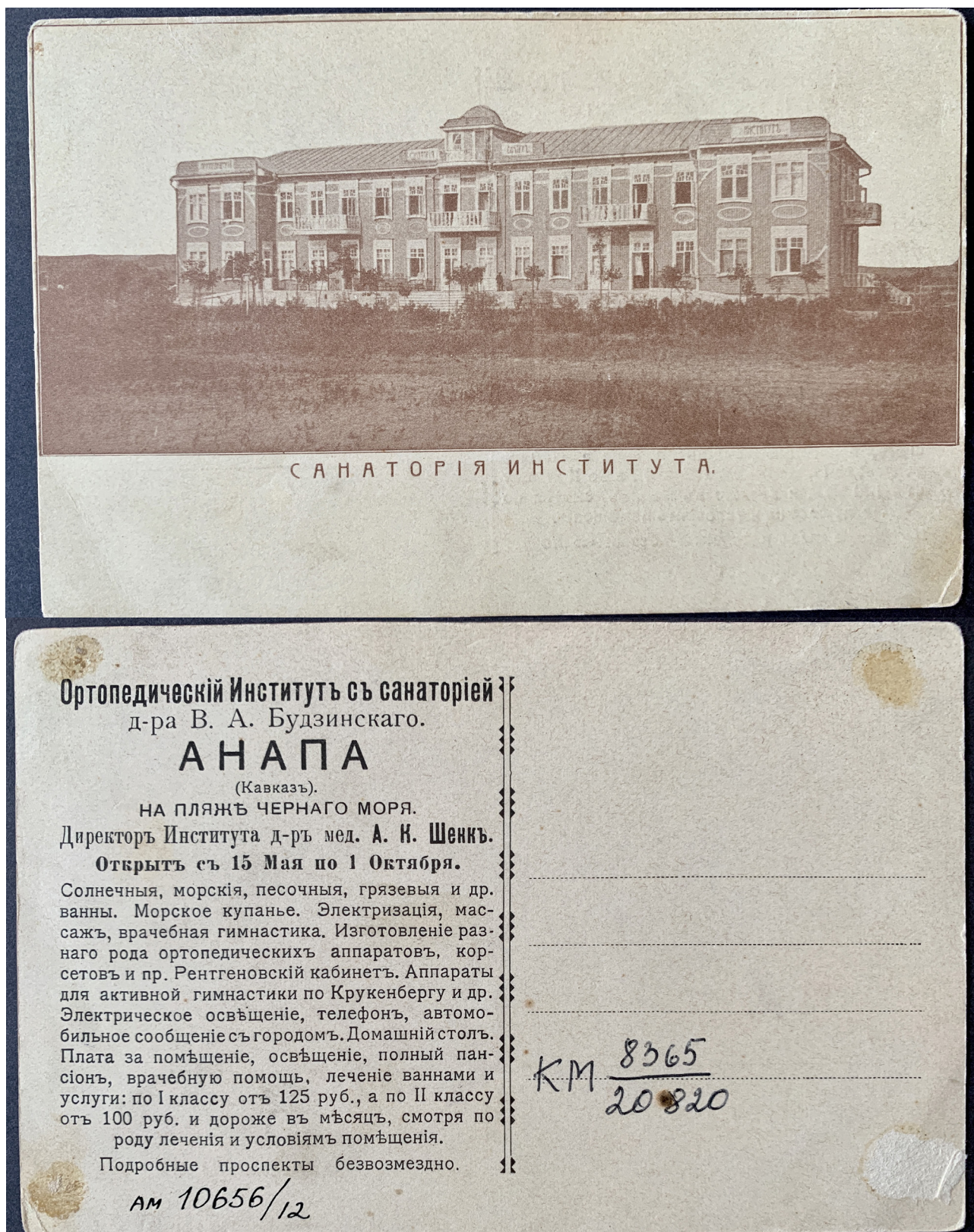
Рис. 9. Открытка «Санатория института». Россия, начало XX в. Из фондов КГИАМЗ им. Е.Д. Фелицына (КМ 8365/20820)