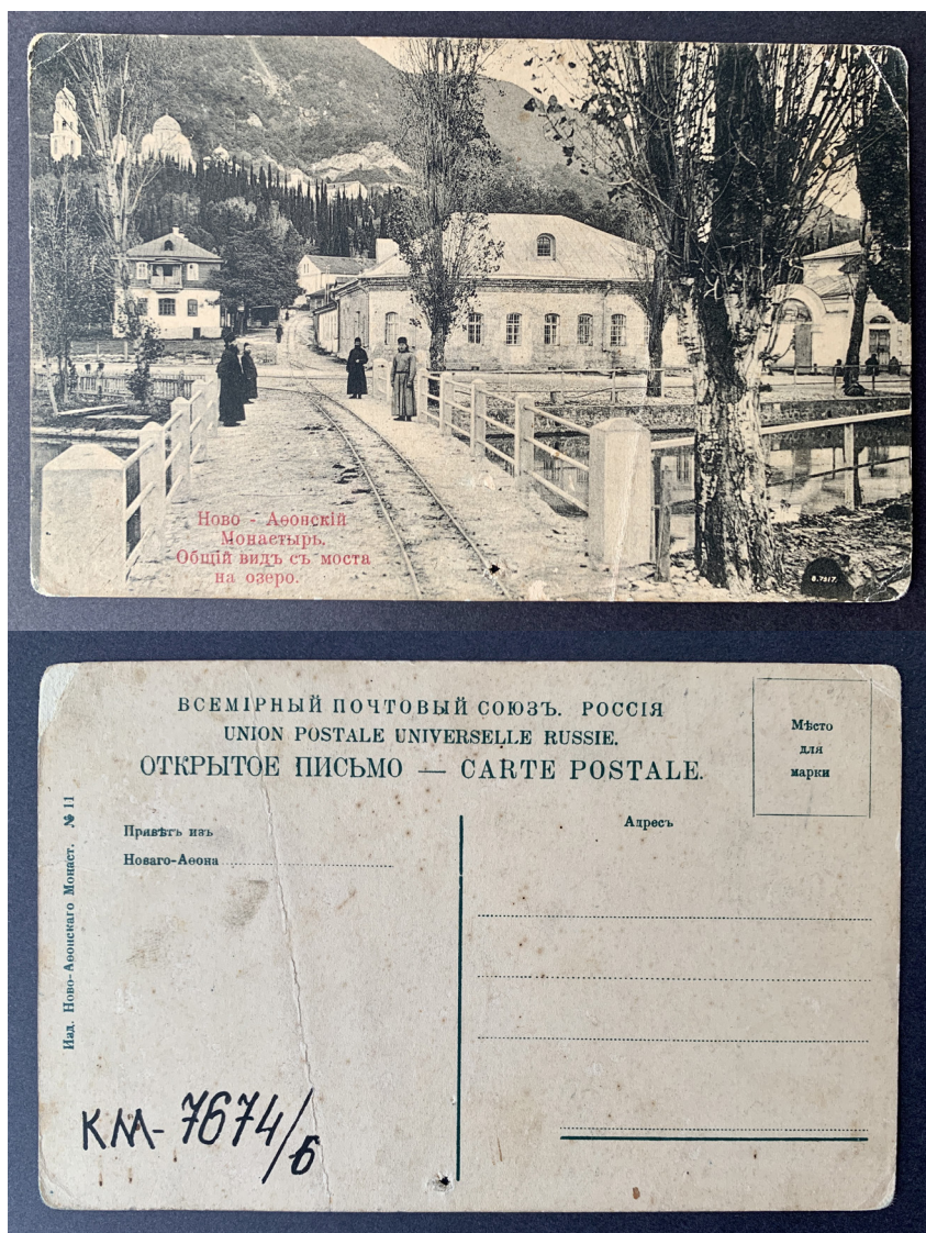
Рис. 3. Открытка «Ново-Афонский монастырь. Общий вид с моста на озеро». Россия, между 1904 и 1909 гг. Из фондов КГИАМЗ им. Е.Д. Фелицына (KM 7674/6)