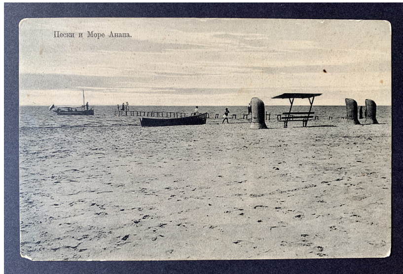
Рис. 4. Открытка «Анапа. Пески и море». Россия, после 1909 г. Из фондов КГИАМЗ им. Е. Д. Фелицына (КМ 8365/21290)