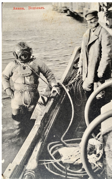
Рис. 6. Открытка «Анапа. Водолаз». Россия, после 1909 г. Из фондов КГИАМЗ имени Е.Д. Фелицына (КМ 8365/16937) Fig. 6. Postcard "Anapa. A Diver". Russia, after 1909. From the funds of the Felytsin Krasnodar Museum (КМ 8365/16937)

ные элементы, фонтаны, беседки, лавочки, освещение), природные объекты (скала Гигант в Анапе, камень «Вера, Надежда, Любовь» в Геленджике, скала Киселева в Туапсе), достопримечательности (якорь, «древние» ворота в Анапе, окрестности Сукко, Семигорский источник и «древняя» мельница неподалеку от Анапы, Михайловский перевал на пути к Геленджику);