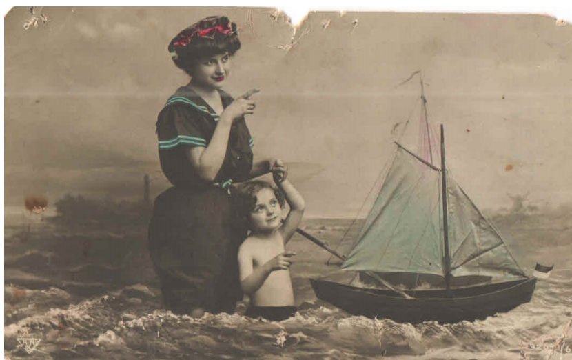
Рис. 7. Открытка. Россия, начало XX в. Из фондов КГИАМЗ им. Е.Д. Фелицына (КМ 9605/5) Fig. 7. Postcard. Russia, early 20th century. From the funds of the Felytsin Krasnodar Museum (КМ 9605/5)

Одна из хранящихся в фондах открыток (издание Оптово-розничного магазина мануфактурных товаров Н. Шах-Назарова и М. Хачадурова в Армавире) выделяется тем, что не является видовой, она на курортную тематику: мама с сыном стоят в воде (море), пускают кораблик; хорошо виден купальный костюм женщины, шапочка на голове, чтобы не намочили волосы (рис. 7).