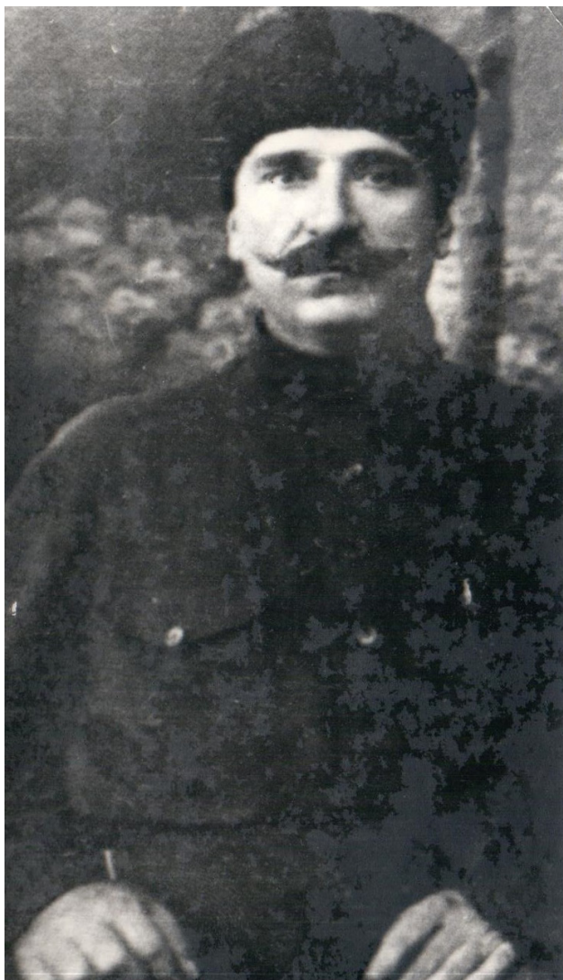
Фото 2. Ибрагим Цей, 1932 год