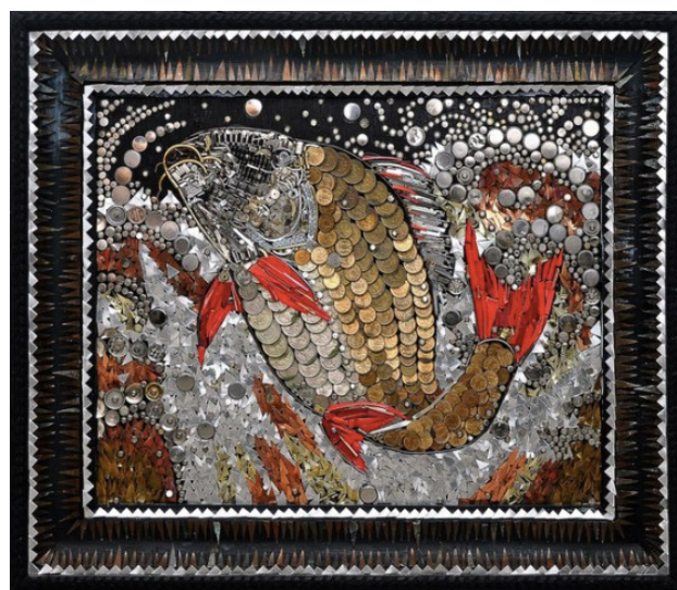
Рис. 5. Ф. М. Петуваш. Сазан. Коллаж. 2009 г. 61 см*71 см

Немного в другой тематической концепции сделаны несколько не менее интересных и содержательных коллажей, таких как «Гера на стойке», «Старая башня», «Речная фея», «Фазан», «Сазан» (рис. 5), «Икар», «На дереве» и «Год крысы». Коллаж «Год крысы» сделан в виде «картинки в картинке» с палитрами и кистями, бессменными атрибутами художника, рожденного для творчества и искусства. 2020 год считается Годом Крысы по китайскому гороскопу, из-за пандемии ставшим очень