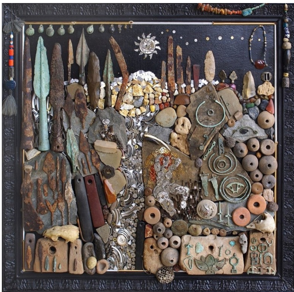
Рис. 2. Ф. М. Петуваш. Сэтэнай. Коллаж. 2006 г. 70 см*70 см Fig. 2. F. M. Petuvash. Setanai. Collage. 2006, 70*70 cm.

Художник Феликс Петуваш, будучи охотником и рыбаком, на протяжении многих лет находил и собирал вымываемые водами водохранилища археологические артефакты, их также приносили друзья, знакомые: тысячи предметов он передал на хранение в фонды Национального музея Республики Адыгея.