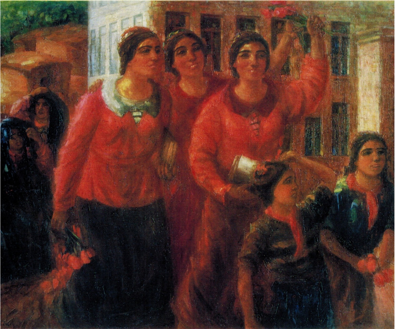
Рис. 6. Волков А.Н. «Студентки». 1935. Холст, масло. Собрание Государственного музея Искусств Республики Каракалпакстан имени И.В. Савицкого