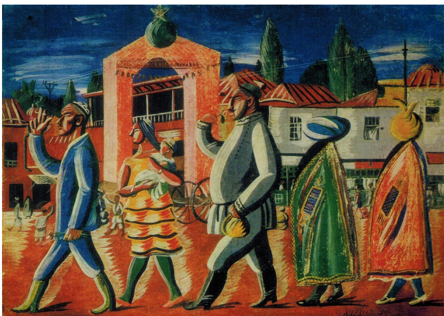
Рис. 4. Курзин М.И. «Старое и новое». 1930. Картон, гуашь. Собрание Государственного музея Искусств Республики Каракалпакстан имени И.В. Савицкого Fig. 4. Kurzin M.I. Old and New. 1930. Cardboard, gouache. Collection of the Karakalpakstan State Museum of Art named after I.V. Savitsky

нила одной из своих установок «воплощение посредством искусства современных революционных идей». Соединив в своих рядах выходцев из Сибири, Москвы, Казахстана и уроженцев Средней Азии, объединение «Мастера Нового Востока» породило новые течения в искусстве и послужило отправной точкой для формирования направлений живописной школы Узбекской ССР [8].