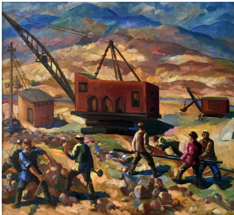
Рис. 5. Волков А.Н. «Экскаваторы». 1934. Холст, масло. Собрание Государственного музея Искусств Республики Каракалпакстан имени И.В. Савицкого

С 1929 по 1941 гг. А. Н. Волков преподавал живопись в Ташкентском художественном техникуме. В 1932–1934 гг. Ленинградская академия художеств отправляет в национальные республики художников, верных тради-