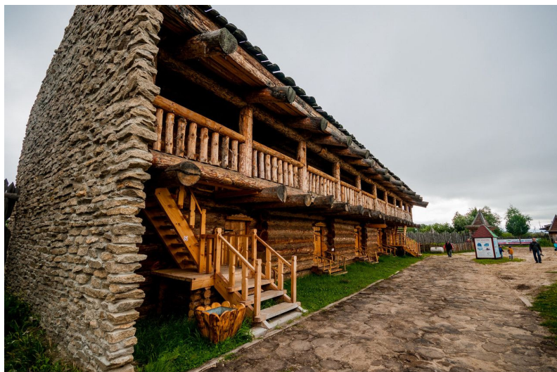
Рис. 4. «Казачьи палаты» – жилые помещения для гостей (гостиничные номера), выполненные в стилистике комплекса [8] Fig. 4. Cossack Chambers, living quarters for guests (hotel rooms), made in the style of the complex [8]

Дорога ведет посетителей к ристалищу, на фоне которого (как компонента инфраструктуры) разворачивается работа средневекового лучного тира для гостей фестиваля, где они могут попробовать себя в стрельбе из лука, историческом фехтовании, бросании копья. Зритель как бы погружается во времена Средневековья: в форме «ожившей истории» демонстрируются быт, обычаи, обряды, элементы единоборств X–XIV вв.