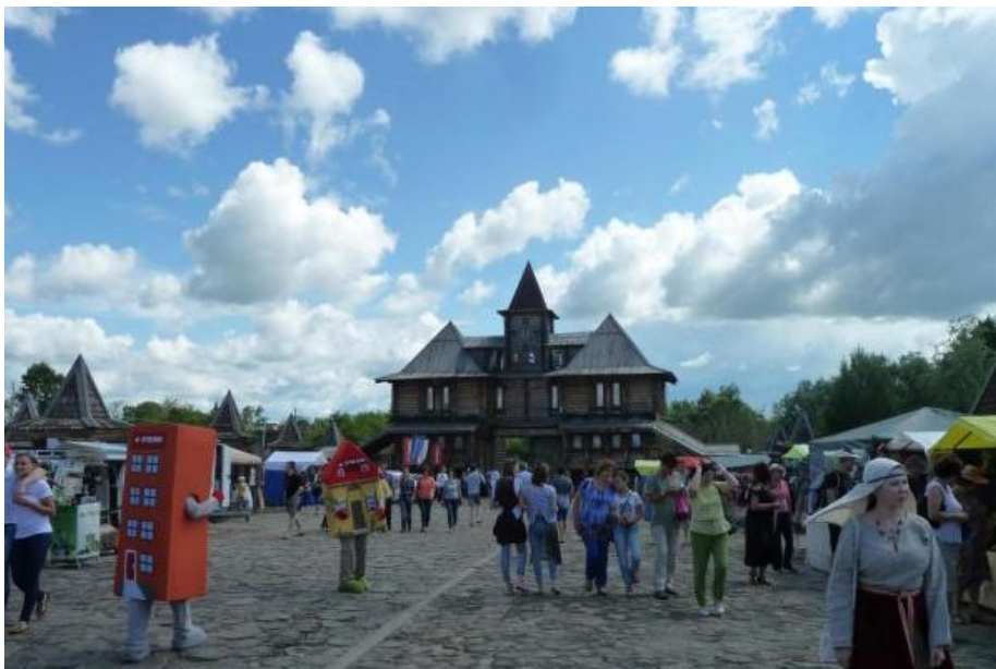
Рис. 7. Ярмарочная площадь комплекса во время проведения фестиваля «Абалакское поле» [1] Fig. 7. Fair square of the complex during the festival Abalak Field [1]

ты» (боевые столкновения) «Стенку на стенку», «На мосту» (рис. 6). Битва на мягких мечах является наиболее безопасной, поэтому занимает особое место среди всех форм поединков.