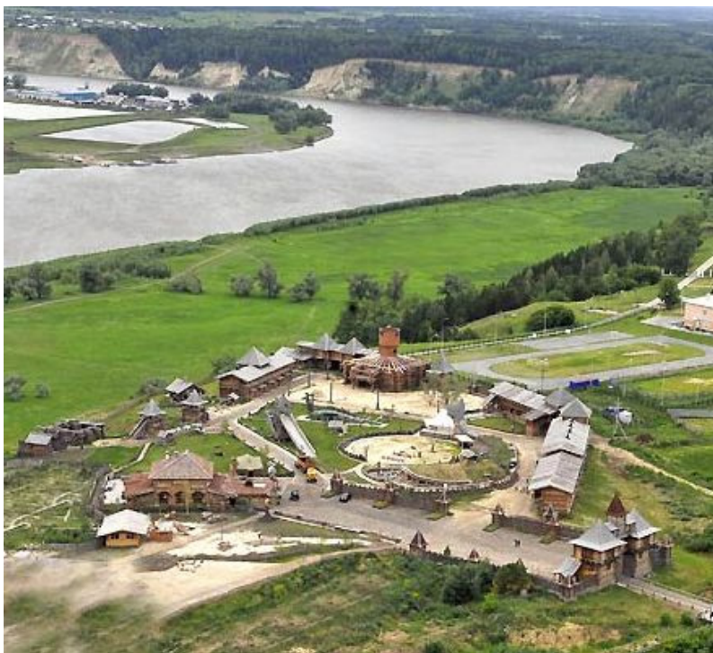
Рис. 2. Туристический комплекс «Абалакская крепость» (общий вид сверху) [1]