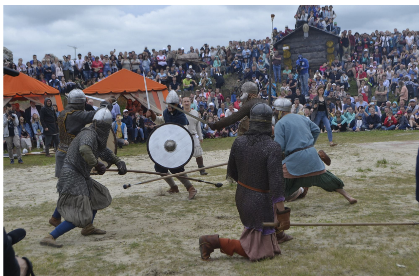
Рис. 6. Фестиваль «Абалакское поле». Театрализованная реконструкция сражения на ристалище [21] Fig. 6. Festival Abalak Field. Theatrical reconstruction of the battle at the tiltyard [21]

и происходит сбор на поединок. В этом пространстве актуализируется образ боевого амфитеатра. Вначале проводится представление и парад воинов в доспехах со знаменами и копьями в шлемах, кольчугах, которое предшествует сражению под барабанный бой. Женщины нараспев благословляют воинов на бой, после чего начинаются рыцарские турниры. Значимой частью являются «бугур-