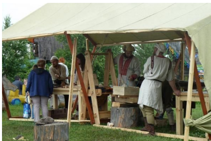
Рис. 8. «Улица мастеров» - пространство для демонстрации реконструированных старинных технологий [21]

5. «Улица мастеров» — единая площадка, где реконструирован быт и ремесла Средневековья — включает низкую крытую двускатной крышей кузницу и гончарную мастерскую, в которых посетителям демонстрируют процессы росписи гончарных изделий, изготовления деревянных журавликов, обработки дерева и создания изделий из него. В ходе работы средневековых интерактивных мастерских проводятся мастер-классы для туристов (рис. 8). Одежда реконструкторов