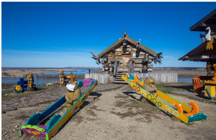
Рис. 9. «Поляна сказок» – пространство для детского отдыха и развлечений [12] Fig. 9. Glade of Fairy Tales, a space for children's recreation and entertainment [12]

6. Пространство для детского отдыха и развлечений («Поляна сказок») — реконструкция сказочного царства (рис. 9), на котором расположены избушка на курьих ножках, деревянная горка и скульптуры сказочных героев (Змей Горыныч, животные, богатыри), старинные качели. Здесь проходит работа детского интерактивного лагеря по подготовке юных воинов и воительниц, в котором опытные инструкторы за два дня знакомят ребенка с особенностями средневековой повседневности. Посредством данного локуса