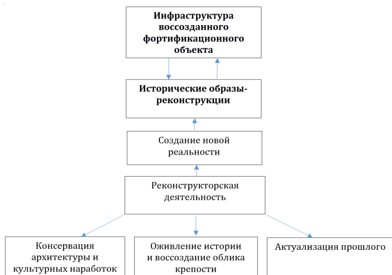
Рис. 1. Методология интеграции исторических образов-реконструкций в инфраструктуру воссозданного фортификационного комплекса Fig. 1. Methodology for integrating historical images-reconstructions into the infrastructure of the reconstructed fortification complex

структуре реконструированной архитектурной среды, в которой посредством образов-реконструкций осуществляется своеобразное моделирование новой реальности.