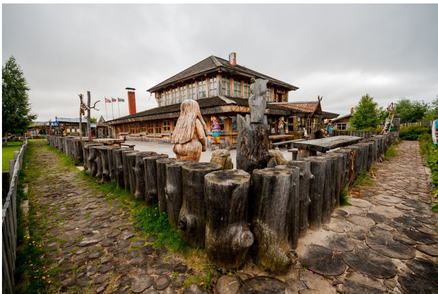
Рис. 5. Общий вид на бытовую зону. Трактир «Белая сова» [8] Fig. 5. General view of the living area. The White Owl Inn [8]

вянного настила, на хозяйственном дворе размещены реконструкции амбаров. В ходе посещения исторического лагеря можно познакомиться с хозяйственной повседневностью людей средневековой эпохи. Перед трактиром «Белая сова» размещена деревянная скульптура русалки (рис. 5), интерьер заведения отражает дух воссоздаваемого исторического периода. В трактире проводится реконструкция обряда средневековой свадьбы, по сценарию помолвка происходит перед боем, — так формируется образ старинного торжества. Затем происходит медовый пир жениха и невесты, «пир на весь мир» в форме сибирского разносола. Вечерние мероприятия представляют собой попытку реконструкции элементов музыкальной культуры Средневековой Руси с игрой на гусях, жалейках, гудке, с участием барабанного сопровождения, с горловым пением, здесь же проводится мастер-класс по средневековым танцам.