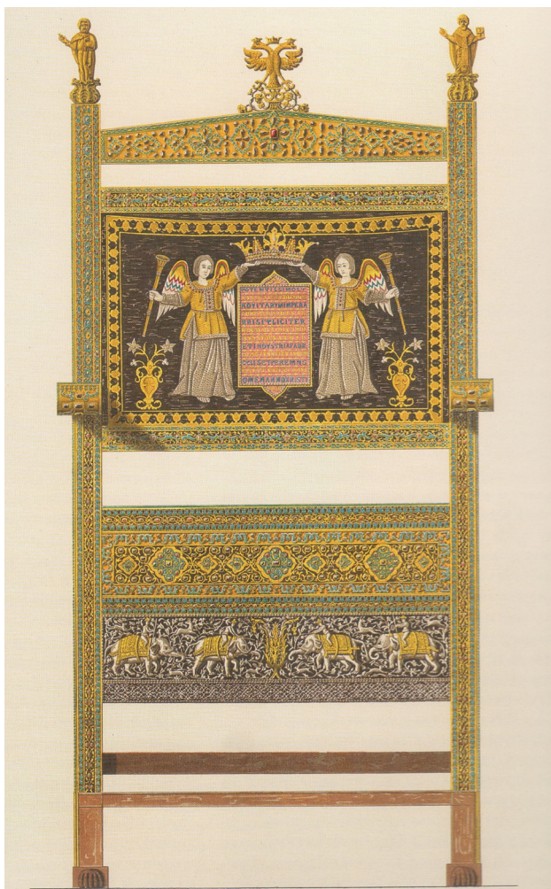
Рис. 1. Тронное кресло царя Алексея Михайловича Романова. Вид в фас [13, № 62] Fig. 1. Throne chair of Tsar Alexei Mikhailovich Romanov. Front view [13, No. 62]