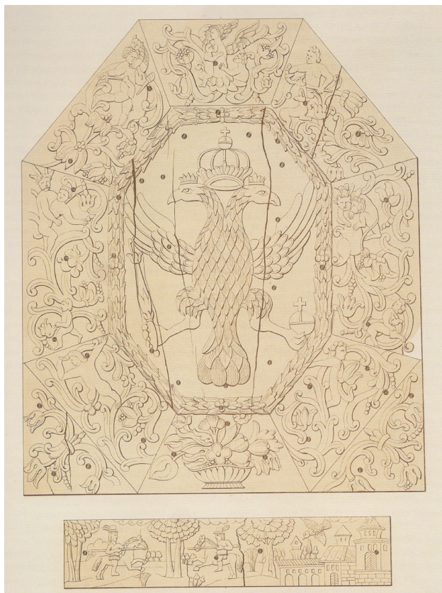
Рис. 4. Тронное кресло «Костяной трон». Центральная часть спинки [13, № 98] Fig. 4. Throne chair «Bone Throne». Center back [13, No. 98]

можно, в основе их художественно-идейного решения общий образец – знаменитый трон царя Соломона, из описания которого в Библии были заимствованы некоторые приемы изготовления: применение слоновой кости, круглые очертания завершения спинки.