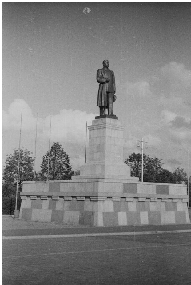
Рис. 1. Памятник Сталину на площади Победы в Калининграде.

По всей видимости, согласие было получено достаточно быстро — памятник Сталину (скульптор Е. В. Вучетич) наконец появился на площади Победы 29 апреля 1953 г. (рис. 1). В репортаже на первой полосе областной газеты «Калининградская правда» подчеркивалось: «С именем Сталина связано и образование нашей Калининградской области. Именем Сталина калининградцы назвали программу хозяйственного и культурного строительства своего края. На каждом шагу мы ощущали отеческую заботу Иосифа Виссарионо-