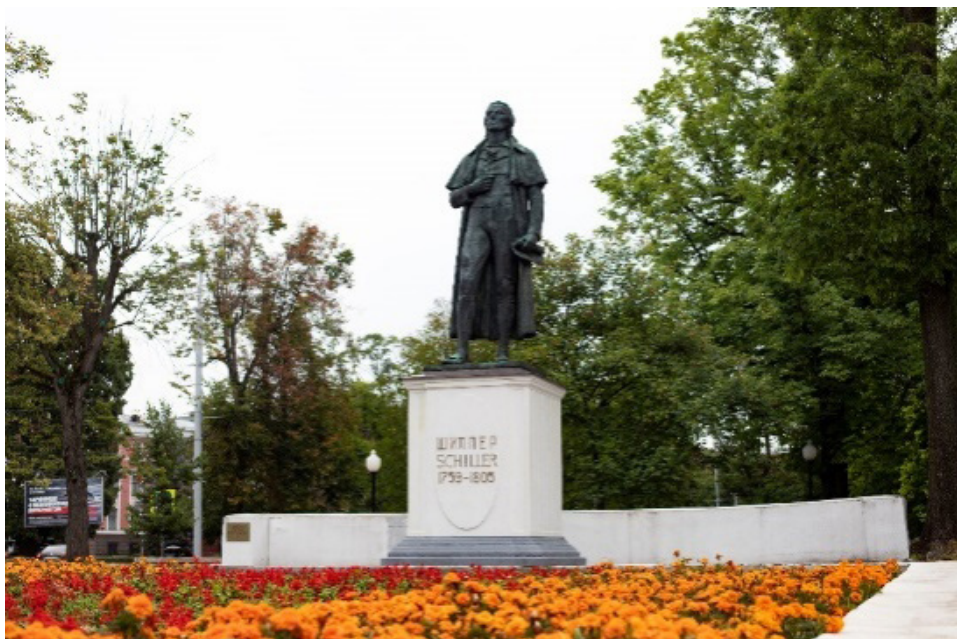
Рис. 9. Памятник Шиллеру в Калининграде, 2020 г.

Шиллер с самого начала, по всей видимости, воспринимался властями как идеологически безупречный автор. Советские издания немецкого классика были доступны в библиотеках, его произведения входили в курс зарубежной литературы в пединституте (университете с 1967 г.), а драматические к тому же ставились на калининградской сцене. Первоначально Шиллер даже рассматривался как компромиссная фигура в процессе удовлетворения культурных потребностей немецкого населения, остававшегося после войны в области. Новость о том, что драмкружок клуба рабочих Неманского целлюлозно-бумажного комбината ставит «Коварство и любовь» Шиллера, была опубликована в октябре 1947 г. в газете «Новое время», издававшейся специально для немецкого населения Калининградской области [53, S. 2].