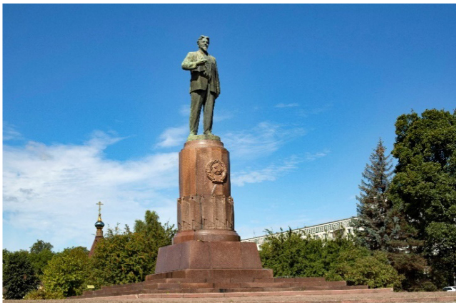
Рис. 3. Памятник Калинин в Калининграде, 2020 г.