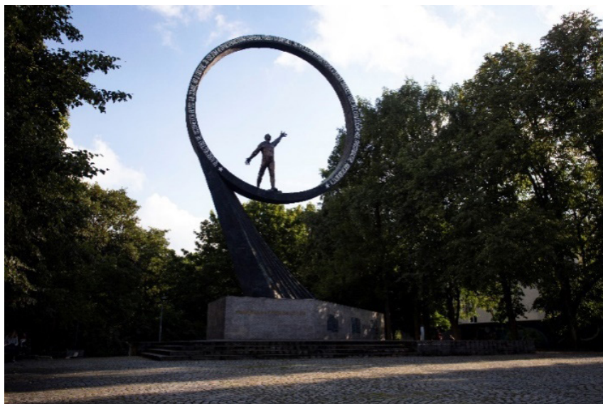
Рис. 5. Памятный знак землякам-космонавтам в Калининграде, 2020 г.