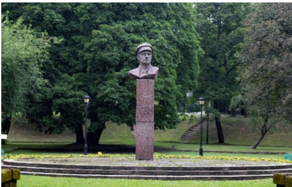
Рис. 8. Бюст Тельмана в Калининграде, 2020 г.

Корреспондент центральной газеты несколько идеализировал ситуацию с памятниками, утверждая, что «советские люди с огромным уважением, с величайшей бережностью относятся к произведениям и памятникам немецкой культуры» [47].