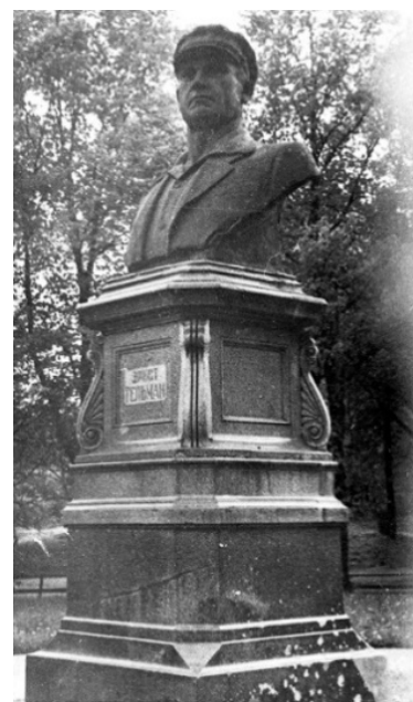
Рис. 7. Бюст Тельмана в Калининграде, после 1956 г.

бре 1969 г. сотрудники краеведческого музея и Калининградского городского отделения Всероссийского общества охраны памятников истории и культуры организовали праздник — День улицы Э. Тельмана. В ходе торжественной линейки пионеры и комсомольцы рассказали об истории и международной дружбе. Зрителям был предложен «театрализованный монтаж», выступали пенсионеры, церемонию завершило возло-