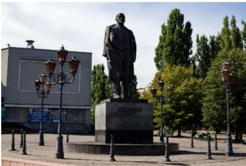
Рис. 2. Памятник Ленину в Калининграде, 2020 г.