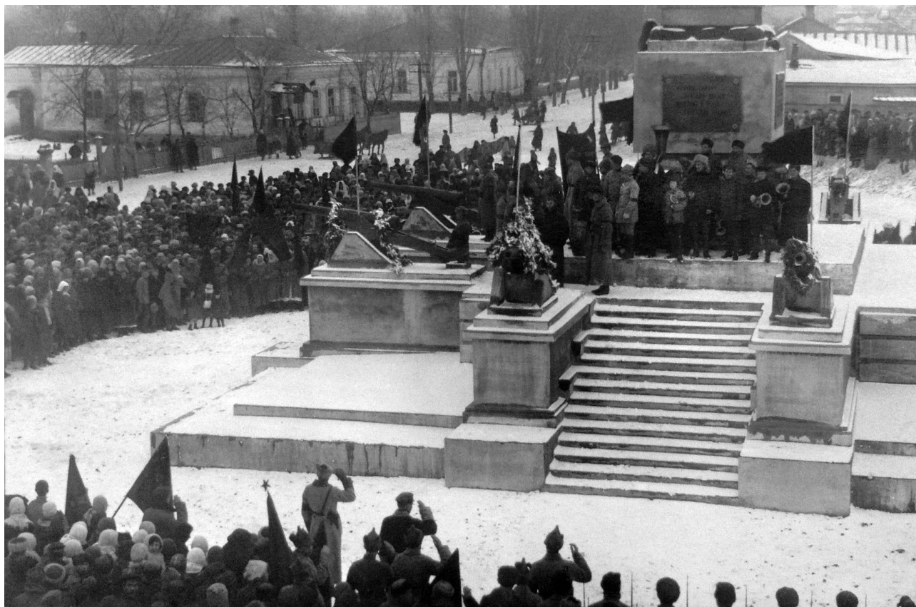
Фото 2. Митинг по случаю открытия памятника. Общий вид (Станица Славянская, 23 декабря 1923 г.)