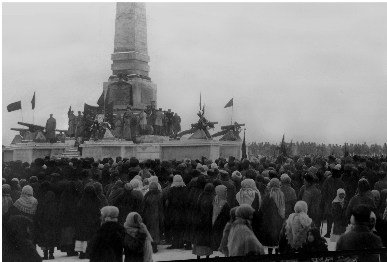
Фото 3. Митинг по случаю открытия памятника. Вид с юга (Станица Славянская, 23 декабря 1923 г.)