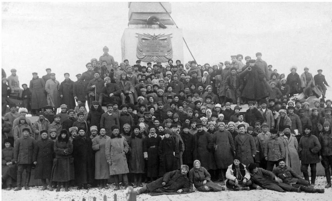
Фото 4. Митинг по случаю открытия памятника. Общее фото участников на фоне монумента (Станица Славянская, 23 декабря 1923 г.)

как революция меняет взгляд людей на мир. Эти очерки были изданы тиражом 3000 экземпляров в виде небольшой брошюры, которую таманцы получили при открытии памятника в качестве подарка [1]. Брошюра была проиллюстрирована художником Григорием Козорезовым. Всего он сделал карандашом и тушью 54 рисунка, которые планировал опубликовать в отдельно изданном альбоме. Намерение автора упиралось в отсутствие денег, которых ему требовалось 300 червонцев. Сведения об издании обнаружены не были, по-видимому, оно не состоялось.