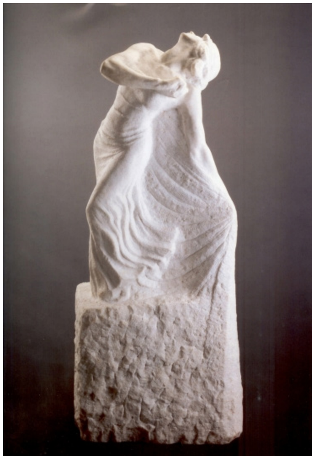
М. Д. Рындзюнская. Балерина Федорова 2-я. 1916, Мрамор. Государственная Третьяковская галерея.

(Следует отметить, что оба скульптора — ученики С. М. Волнухина — долгое время тесно общались. В 1907–1914 гг., когда Эрзья находился в Европе, они переписывались. Осенью 1910 г. Рындзюнская приезжала к Эрзье в Париж, где находилась до весны 1911 г. Он выполнил несколько ее портретов в Европе и один — сразу после возвращения в Россию в 1914 г.) В апреле 1915 г. журнал «Рампа и жизнь» публикует фотографию, на которой зафиксирован один из начальных моментов работы Рындзюнской над рассматриваемым произведением. Снимок сделан в мастерской скульптора: Федорова, одетая в обычное (не сценическое) платье, стоит, держа в руках белую кружевную шаль; Рындзюнская лепит с нее модель скульптуры. Завершено произведение было лишь в 1916 г.