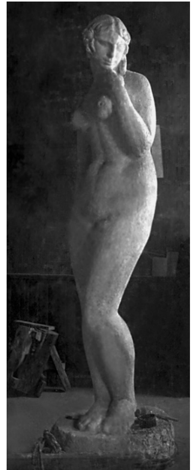
С. Д. Эрзя. Баба (1916, цемент). Не сохранилась. Фотография. Центральный государственный архив Республики Мордовия.