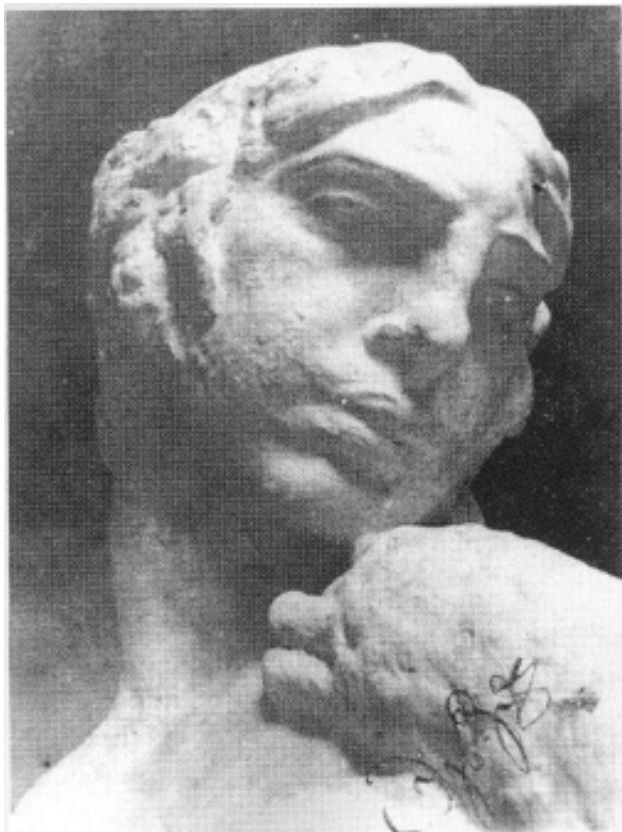
С.Д. Эрзя. Баба (1916, цемент). Не сохранилась. Деталь. Фотография. Центральный государственный архив Республики Мордовия.

315), в другом месте: «1915 г. Москва» [16, фотография № 204].