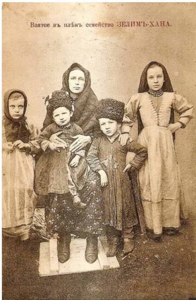
Взятое в плен семейство Зелимхана (почтовая карточка, 14 x 8,8 см. [не позднее 1912 г.]). Издание книжного магазина А. В. Дейкарханянца, г. Владикавказ

шую экспедицию для поимки абреков и, главным образом, Зелимхана. На его поимку и ликвидацию было снаряжено в поход более двух тысяч солдат и казаков. За голову знаменитого абрека была назначена награда в 18 тысяч рублей. Рассказывают, что даже вражье ружье не стреляло, если оно было направлено на Зелимхана. По народной легенде, Зелимхан и его оружие обладали чудодейственной силой, что помогало герою долгое время оставаться неуловимым.