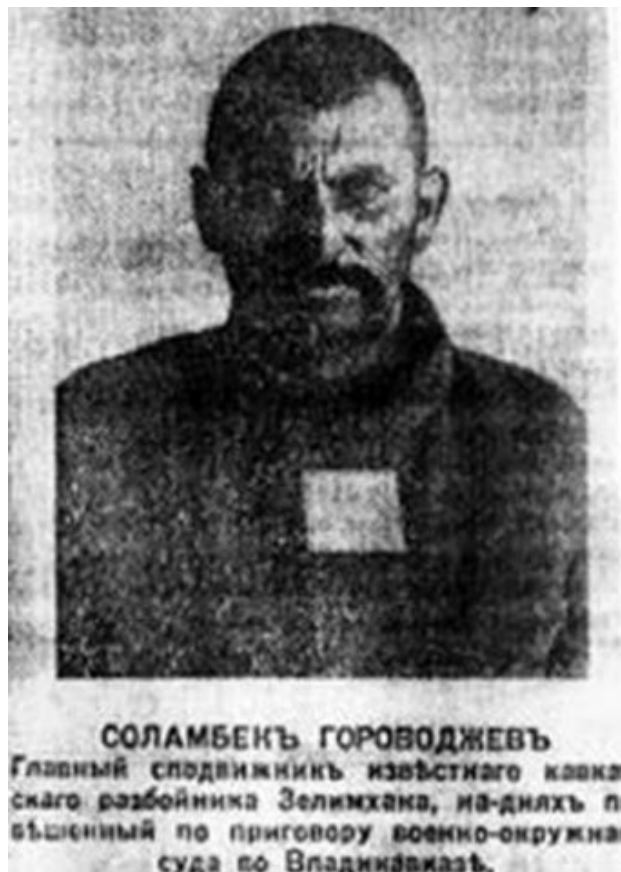
Абрек Суламбек Гараводжев (Сагопшинский) (Соламбек Гораводжев). Фото из газеты с пояснительной надписью («Кавказская копейка» (Баку) 1911 г., 25 августа) [?]

Подчеркиваемая отличительная черта абреков — защита бедных, обездоленных людей. Так, в преданиях повествуется, как