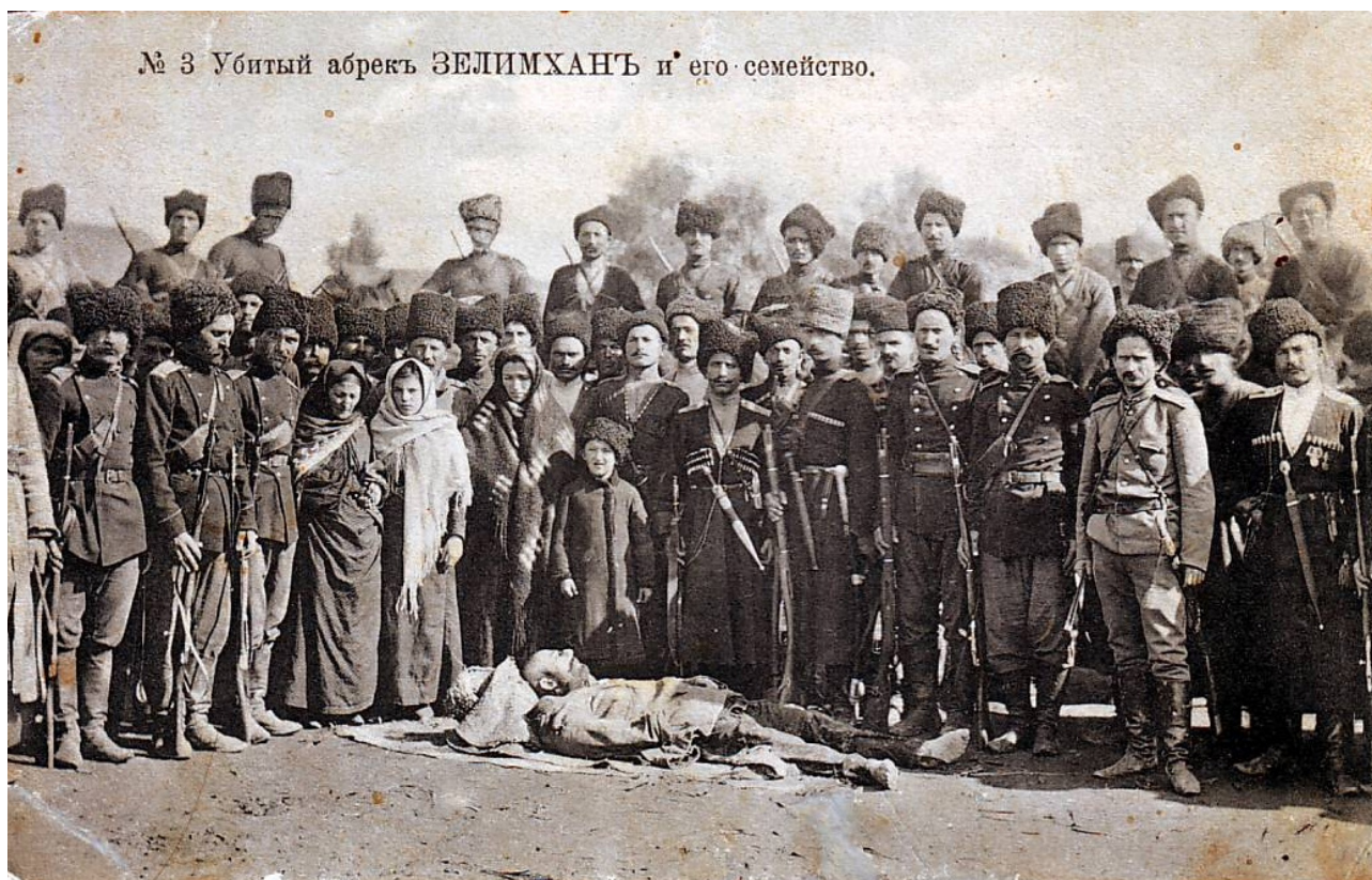
№ 3 Убитый абрেকъ ЗЕЛИМХАНЪ и его семейство.