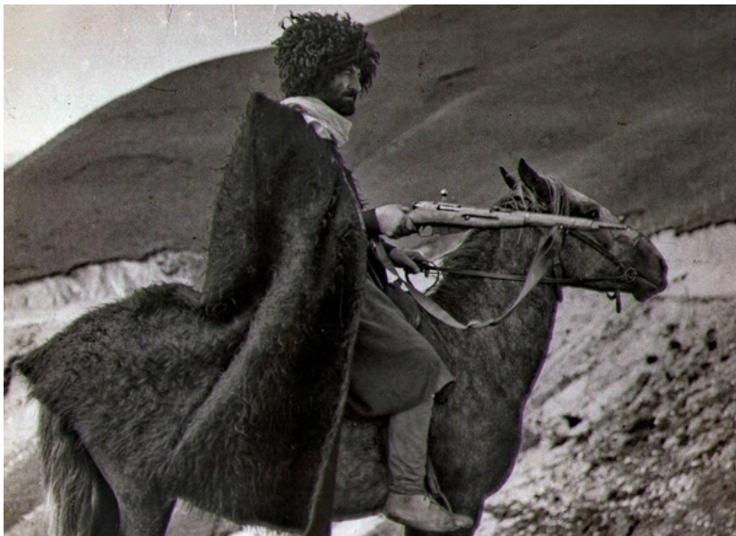
Верховой горец в бурке, с кавалерийским карабином системы Мосина-Нагана в руке. Именно так в начале XX столетия выглядели кавказские абреки

вых и экономических проблем, обусловленных особенностями процесса исторического развития этноса. Формирование абречества в условиях аграрно-общинного быта можно связать также с долгим отсутствием государственности в обществе, необходимостью защиты рода и членов семьи от нападения со стороны.