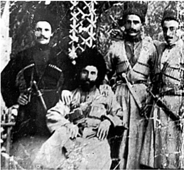
Абрек Зелимхан Харачоевский (сидит) со своими товарищами